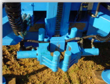
Frein de tige hydraulique Hydraulic rod clamp