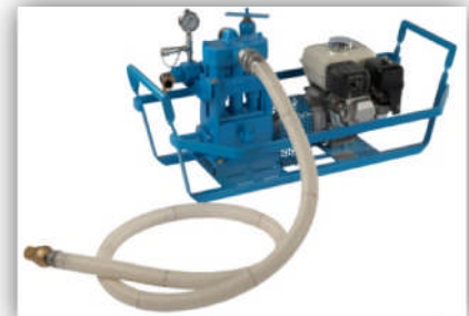
Pompe d'injection Injection pump