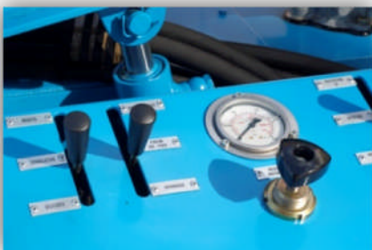
Pupitre de commande Control panel